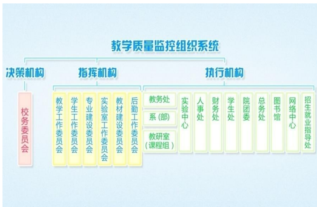
图 3-4 教学质量监控组织系统

决策机构是校务委员会，负责指导教学质量监控与保障体系的制订、修改和实施；决定有关保证和提高教学质量的重大政策和措施；监督各个指挥机构、执行机构的工作情况。