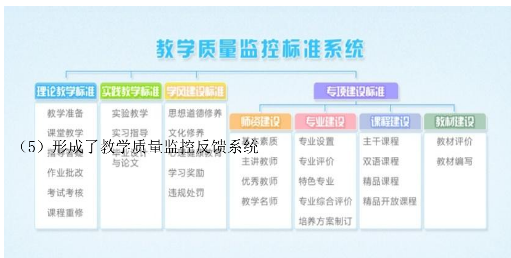
图 3-7 教学质量监控标准系统图

质量标准是指衡量教学活动的准则，是监控或评估对象开展教学活动的行动的准则和相关管理者进行价值判断的依据。目前商务英语专业的质量标准系统，如图 3-7 所示，整个系统包括“理论教学标准、实践教学标准、学分建设标准、专项建设标准”4 个子系统。其中，理论教学标准子系统包括教学准备、课堂教学、指导答疑、作业批改、考试考核、课程重修 6 个模块；实践教学标准子系统包括实验教学、实习指导、毕业设计与论文 3 个模块；学风建设标准子系统包括思想品德行为、心理健康、学习奖励、违规处罚、文化修养 6 个模块；专项建设标准子系统包括师资建设、专业建设、课程建设、教材建设 4 个模块。