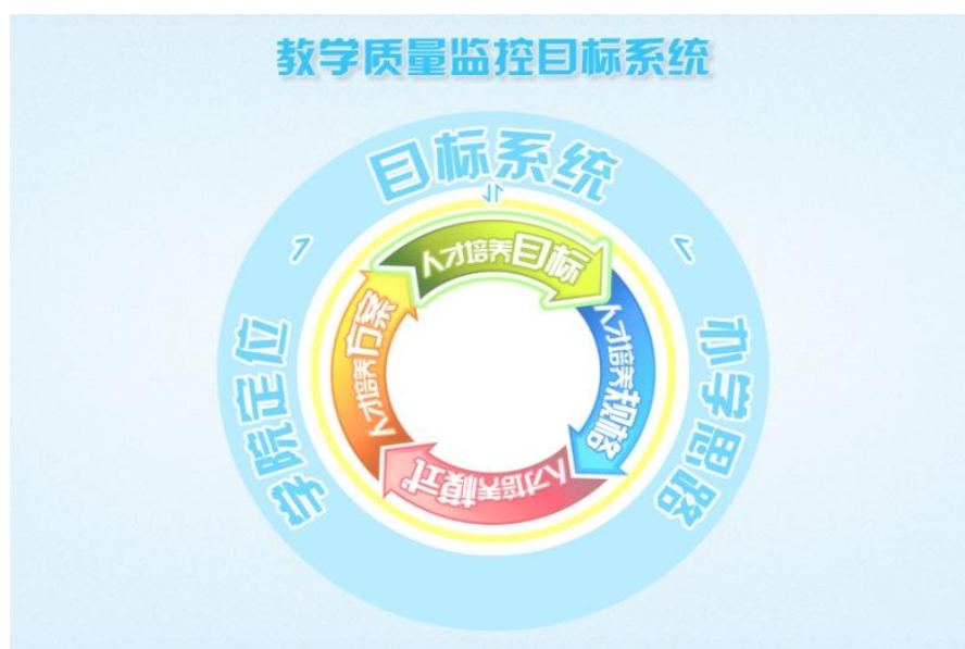
表 3-3 教学质量监控目标系统

目标系统是总纲，是质量监控的方向，商务英语专业建立了预期结果清晰的质量监控目标系统，如图 3-3 所示。首先，在明确学院定位、办学思路和发展目标的基础上，明确了商务英语专业定位和发展目标。其次，依据学院本科人才培养的指导思想，明确了本专业的商务人才培养目标，构建了以能力培养为重心，知识、能力、素质协调发展的外向型、复合型、创新型、应用型本科商务经营与管理人才培养体系。最后，形成了指导方向明确的专业发展规划。