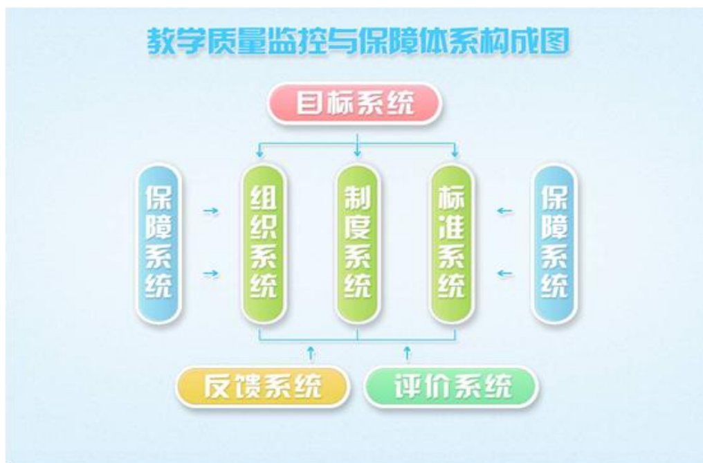
图 3-2 教学质量监控与保障体系构成图

质量监控体系，如图 3-2 所示，并以此为指导实施教学全过程管理与监控，发挥既有激励功能、又有约束功能的教学质量监控机制的作用。