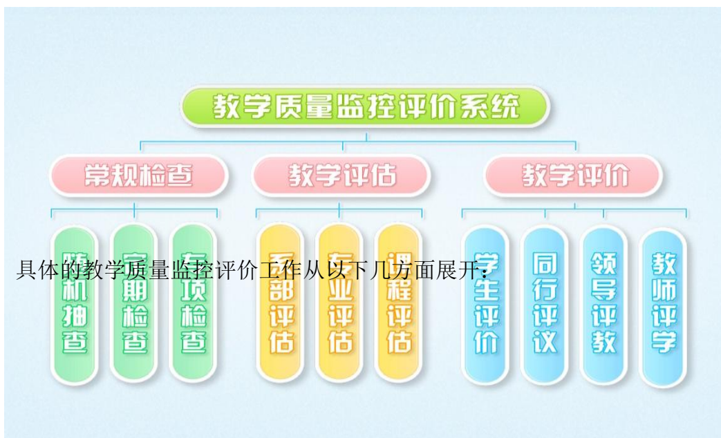
图 3-9 教学质量监控评价系统

质量监控评价系统的功能是依据监控目标、监控标准，根据相关信息，比较实施结果，分析偏差产生原因，采取对策纠正偏差，不断提高教育教学质量。商务英语专业教学质量监控评价系统，如图 3-9 所示，包括常规检查、教学评估和教学评价 3 个子系统。常规检查子系统由定期检查、随机检查、专项检查 3 个模块构成；教学评估由系部评估、专业评估、课程评估 3 个模块构成；教学评价由学生评价、同行评议、领导评教、教师评学 4 各模块构成。